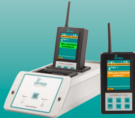
separate Ladestation für Messenger Alarm-Pager variabel stationierbar, benötigt keine Verkabelung