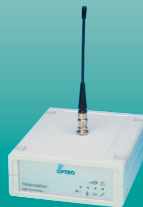
Relaisstation (optional) Erweiterung der Funkreichweite bei größeren Bereichen; benötigt keine Verkabelung

Funkstreckenkontrolle Höchste Übertragungssicherheit durch Empfangsbestätigung und Lesequittierung