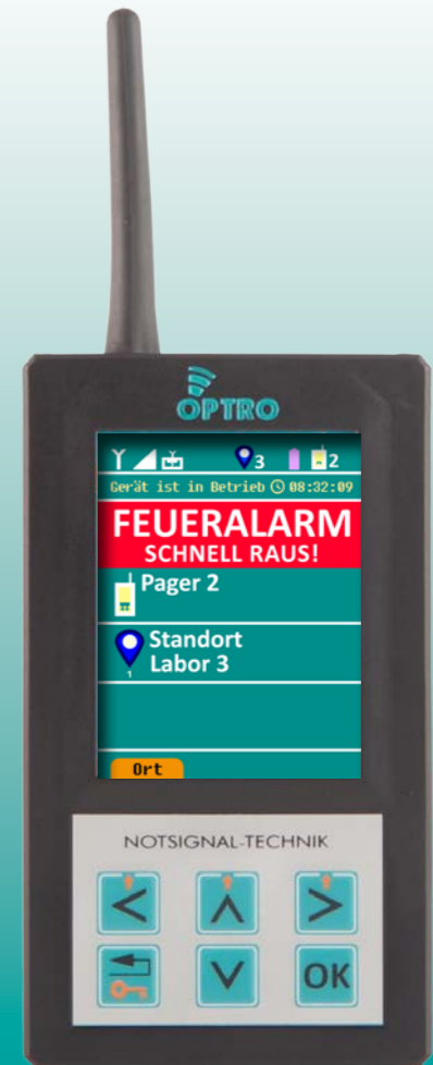
Alarm-Pager empfängt Warnmeldung vom Interface – Signalisierung durch Akustik und Vibration – sowie Klartext-Info auf dem Display