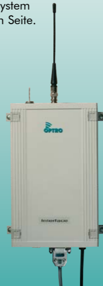
Funk-Sende-Modul Eingangsmeldung der GMZ und Weiterleitung per Funk an den Alarm-Pager